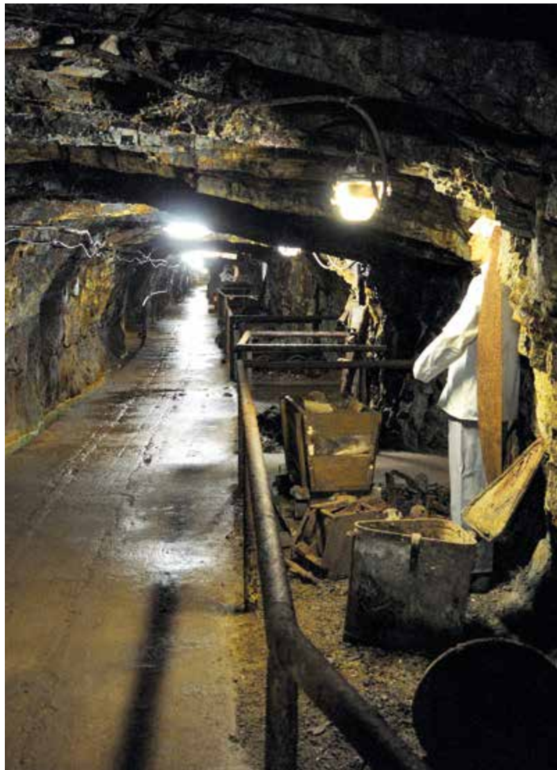
Den Bergbau hautnah erleben im Kilianstollen